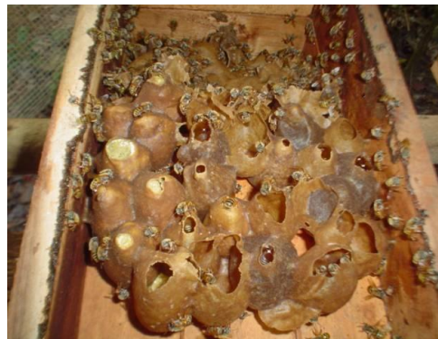
Figs. 13-14. Nuevas colmenas resultado de la multiplicación al año siguiente.