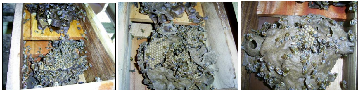
Figs. 10-12. Desarrollo los días 0, 10 y 15.

Después del traslado a cajas racionales del sistema Nogueira-Neto, se apreció el proceso de establecimiento exitoso de las nuevas colonias, con el progresivo desarrollo del involucro de protección de la cámara de cría (Figs. 10-13).