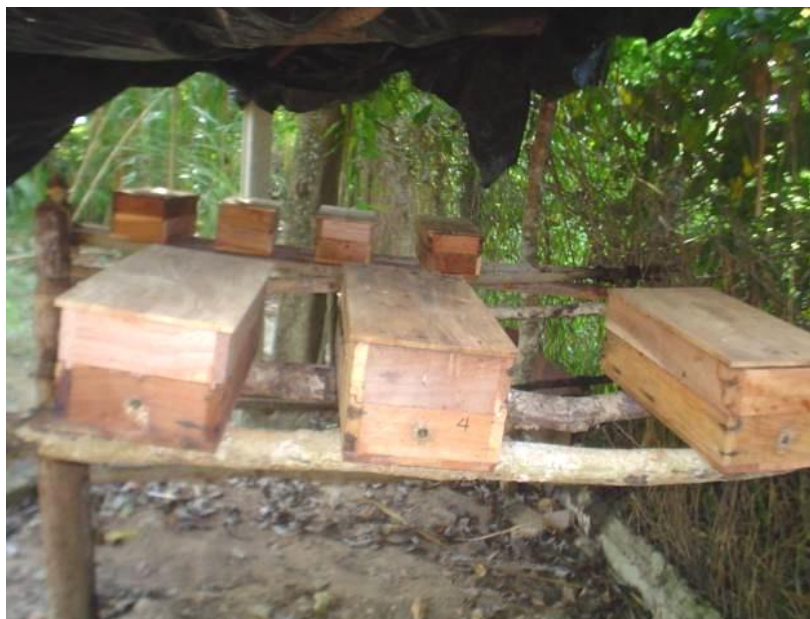
Fig. 15. El meliponario con siete (7) colmenas, tras la multiplicación exitosa de tres colonias un año después de su establecimiento en cajas racionales (Ornamentación alrededor de las piqueras).

Partiendo de experiencias como las de Quezada-Euán (2005) y Leal (2007) en México y Cuba, respectivamente, la exitosa multiplicación de tres colonias sin que se suministrara alimentación en épocas de “penuria” evidencia que se encuentran en un lugar ecológicamente propicio y que la no existencia de más colonias en estado natural aquí se debe al exterminio inicial y la carencia de alojamientos adecuados.